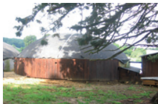
La méthanisation de résidus agricoles